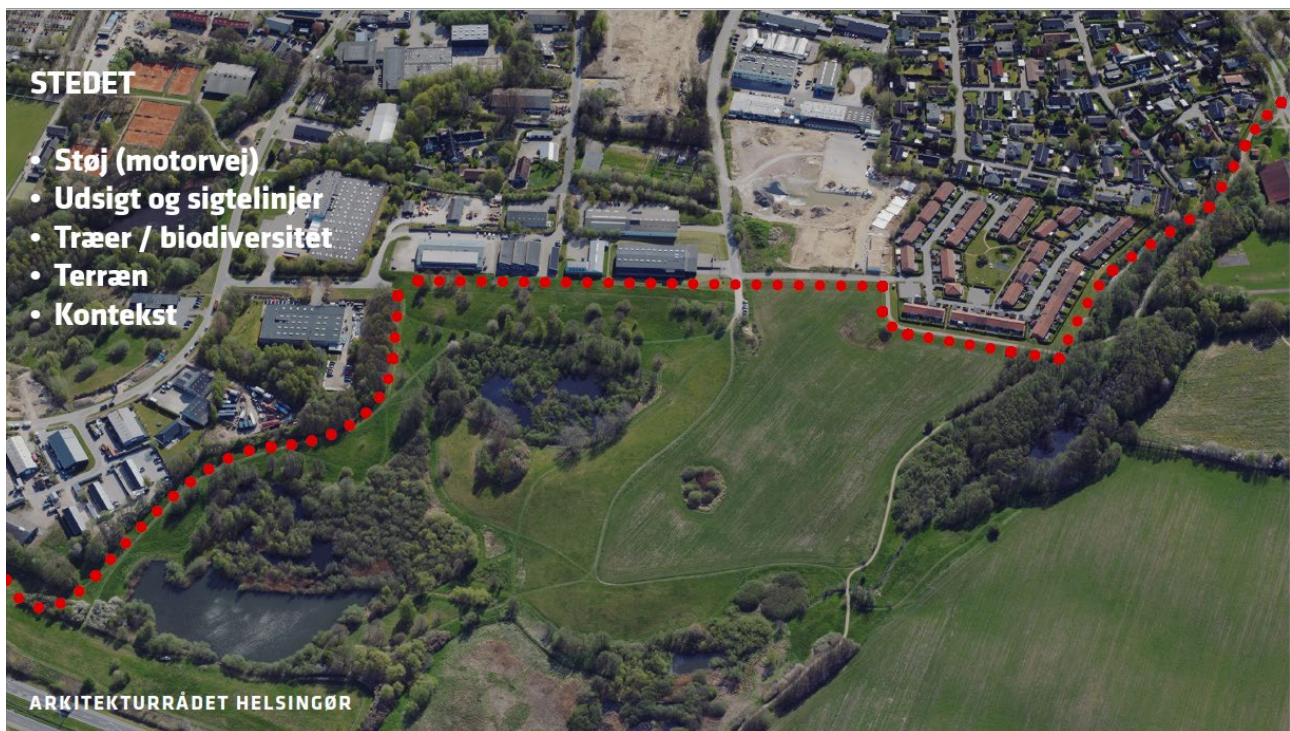
Arkitekturrådets overordnede overvejelser om stedet